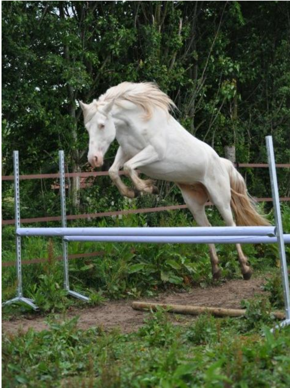
Kiss Me St Hymer