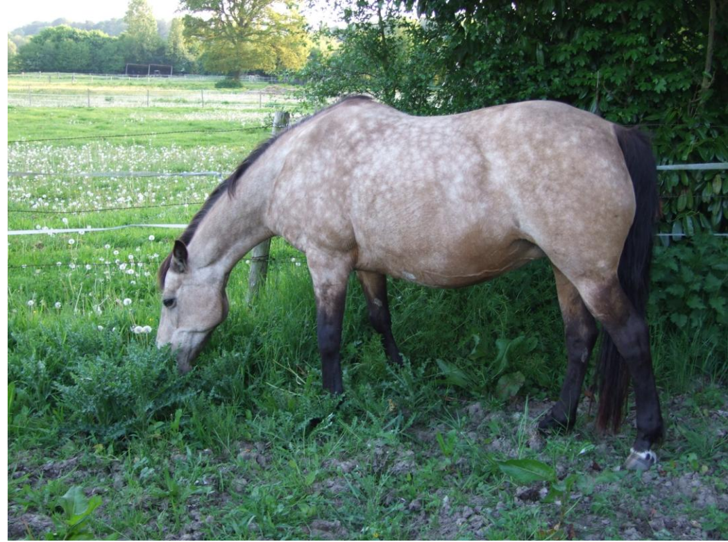
Quazimir de Caux (premier produit de Kiss me)